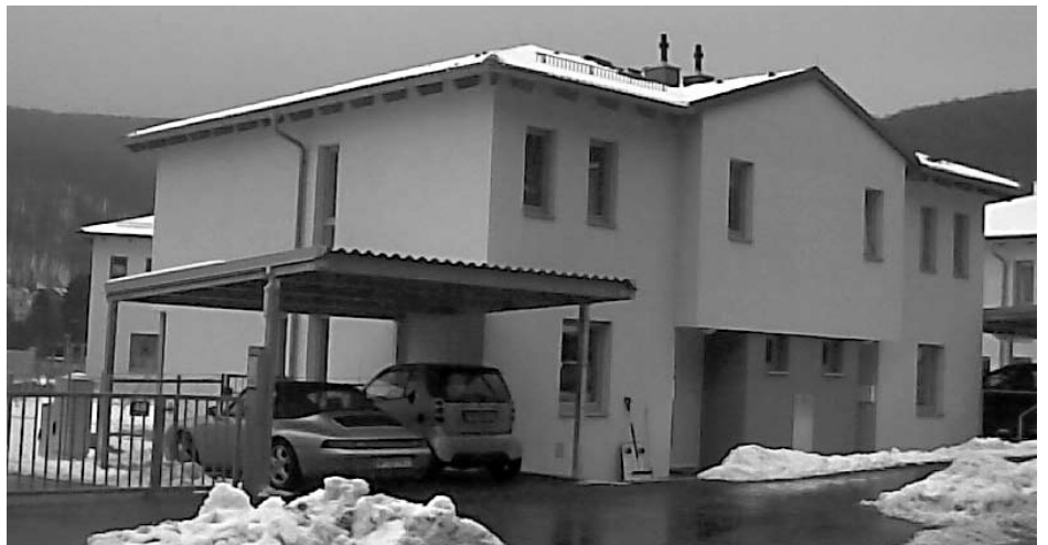
Ein kommunaler Wohnbau wäre für Gemeinde und Wohnungswerber billiger gekommen

Wir haben auch gegen das Engagement der Gemeinde im frei finanzierten Wohnbau gestimmt. Die Gemeinde soll sich auf den sozialen Wohnbau konzentrieren, da liegen ihre gesellschaftlichen Aufgaben. Leistbare Wohnungen als Gegengewicht gegen