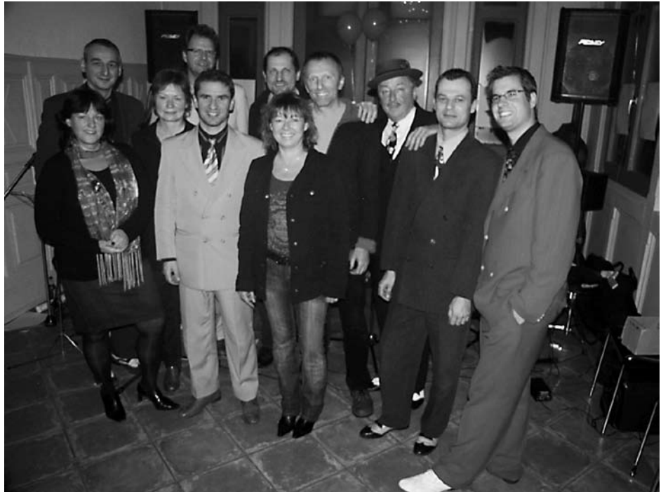
„5 in love“ eröffneten den Veranstaltungsreigen im Salettl

Wir möchten aber mit dieser Art Veranstaltungen auch zeigen, dass es sehr wohl möglich ist, in Purkersdorf qualitativ hochwertige Kultur und Kleinkunst oder auch Filmabende zu erleben. Die Größe einer Veranstaltung ist nicht Gradmesser für die Qualität. Es soll auch ein Zeichen dafür sein, dass auch kleine Gruppen etwas zustande bringen und zum Allgemeinwohl beitragen ohne hunderttausende Euros dafür zu verwenden. Eine der größten Herausforderungen der nächsten Jahre und der nächsten Gemeinderäte wird es sein, zu sparen, weil der Gesamtschuldenberg der Stadtgemeinde und der Wipur (Wirtschaftsbetriebe Purkersdorf) es nichts anders zulassen wird.