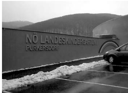
Ein Shuttle-Dienst wird Morgens das Verkehrsaufkommen in der Wintergassewieder etwas reduzieren

Die Wintergasse ist die längste Sackgasse Purkersdorfs. Als Standort für den neuen Kindergarten ist sie denkbar schlecht geeignet. Wir haben schon im Vorfeld auf die kommende Verkehrsproblematik hingewiesen. Rund 500 zusätzliche Autofahrten pro Tag sind für die AnrainerInnen, aber auch für die betroffenen VerkehrsteilnehmerInnen eine Zumutung. Daher haben wir schon in der Planung des