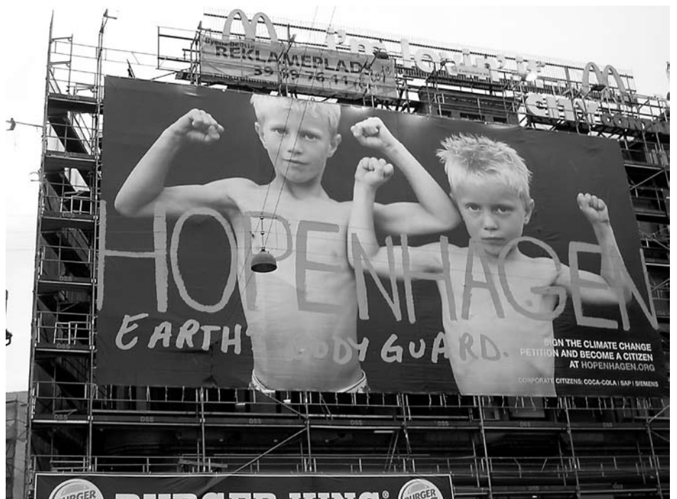
Hoffnung für Kinder zwischen McDonalds, Coca Cola und Burgerking