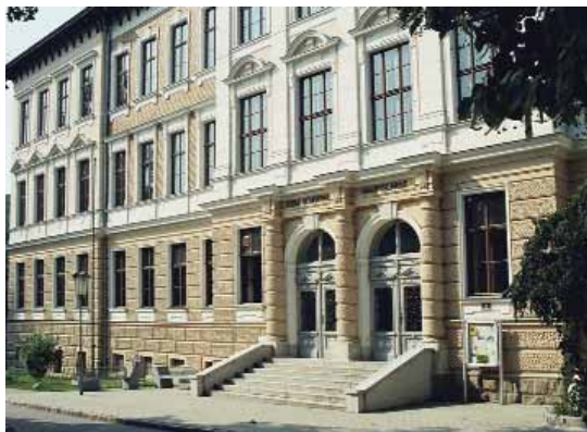
◀ Josef-Schöffel- Hauptschule, Alois-Mayer-Gasse 4

lernen die Stadt als zentralen Ort kennen. Die mit dem Schuljahr 1977/78 von der Stadtgemeinde Purkersdorf gegründete Musikschule hat sich zu einer Purkersdorfer Institution entwickelt. Begonnen hat das Projekt mit 24 SchülerInnen. Gegenwärtig besuchen über 700 Personen den Unterricht an der Musikschule Purkersdorf. Bei vielen Veranstaltungen präsent, ausgezeichnet mit Preisen, ist die Musikschule ein wichtiger Bestandteil der Purkersdorfer Kulturarbeit. Die Zusammenarbeit mit der Stadtkapelle zeigt, welche Leistungen durch die Ausnutzung der Synergieeffekte möglich sind.