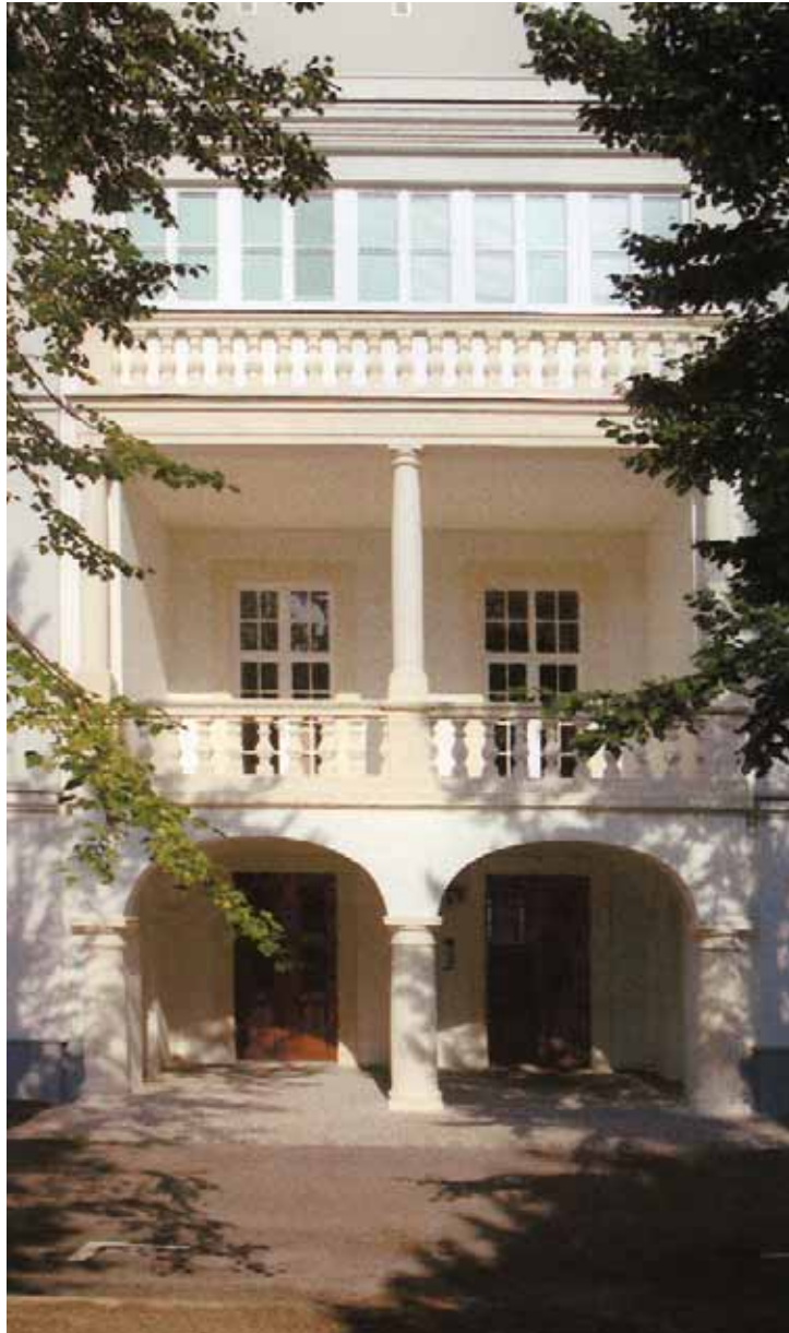
◀ Fürstenbergsches Sommerpalais Wohnhausanlage Herrengasse 8.

Mit der Gründung der WIPUR GmbH beschriftet die Stadtgemeinde Purkersdorf moderne Wege der kommunalen Wirtschaftsverwaltung. Die gegenwärtigen Entwicklungen im Bereich der staatsnahen Wirtschaft machen für Gebietskörperschaften ein dem wirtschaftlichen Erfolg verpflichtetes Unternehmen unentbehrlich. Viele Aufgaben können ausgegliedert werden und bleiben aber trotzdem unter der politischen Aufsicht der gewählten Volksvertreter. Die wirtschaftlichen Erfolge des Unternehmens, dessen Gewinne wiederum der Stadtgemeinde zugute kommen können, und die professionelle Durchführung der der Tochterfirma übertragenen Aufgaben machen die WIPUR GmbH zu einem für die Stadtgemeinde nicht mehr wegzudenkenden wichtigen Wirtschaftsfaktor.