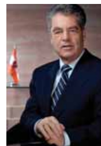
Dr. Heinz Fischer Bundespräsident der Republik Österreich

Aus allen diesen Gründen bedanke ich mich für die Vielfalt der Leistungen, die in Purkersdorf und für Purkersdorf in den letzten vier Jahrzehnten erbracht wurden, und wünsche der Stadtregierung sowie allen Bürgerinnen und Bürgern, dass es ihnen gemeinsam gelingen möge, den Erfolgsweg Ihrer Stadtgemeinde zu erhalten und weiterzuführen!