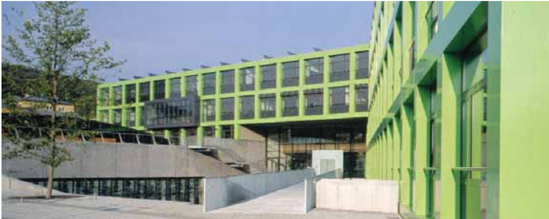
◀ BG|BRG Purkersdorf, Herrengasse 4