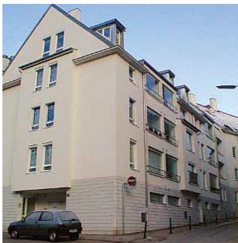
► Wohnbauten in der Karl-Kurz-Gasse

Die Stadtgemeinde betreibt seit 1970 eine aktive Wohnbaupolitik. Dabei wurde und wird besonders die Zusammenarbeit mit Wohnbauunternehmen gesucht.