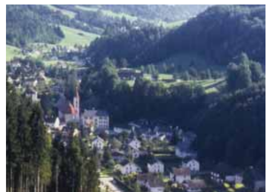
▲ Göstling an der Ybbs, Blick ins Zentrum