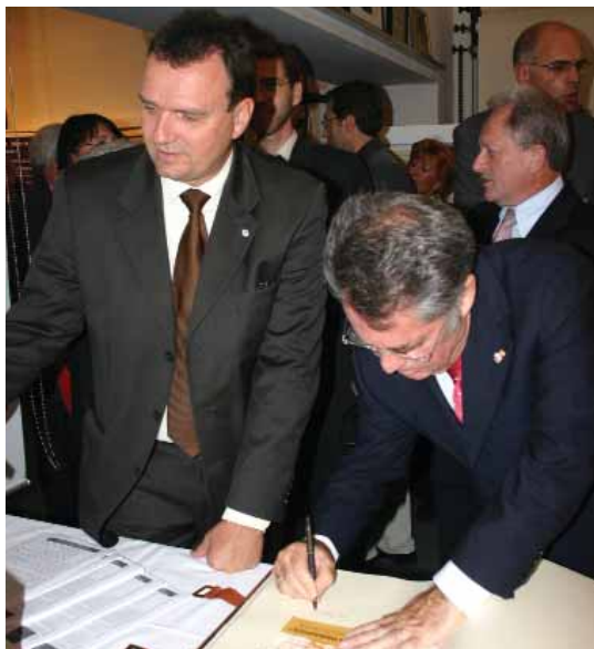
◀ Bundespräsident Dr. Heinz Fischer trägt sich in das Goldene Buch der Stadtgemeinde ein.