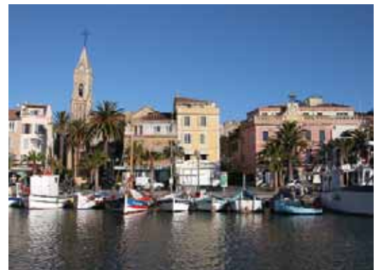
▲ Sanary sur Mer, Blick in den Hafen