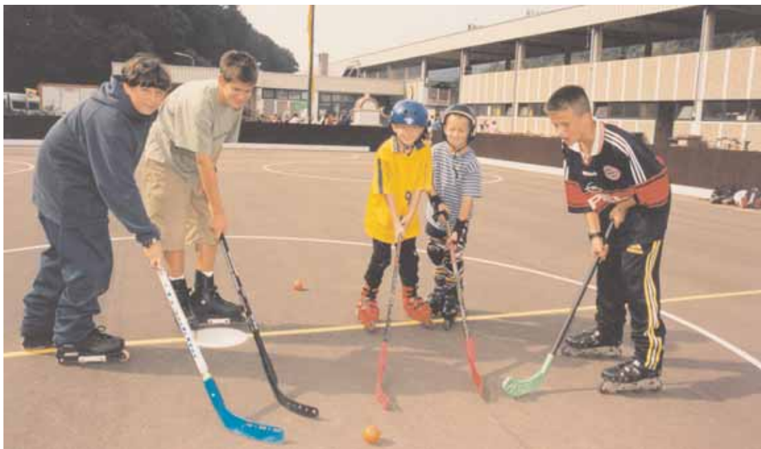
◀ Sportliche Aktivitäten der Jugend

Sportanlage Speichberg errichtet 1974-1978