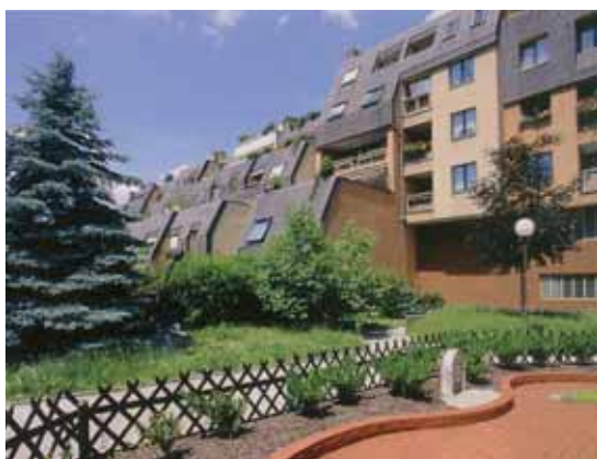
► Wohnbau Hardt-Stremayr-Gasse

Das Konzept der Bereitstellung von Wohnraum in Zusammenhang mit der Verbauung von Freiflächen und ehemaligen Gärten fand nicht immer die ungeteilte Zustimmung der ansässigen Bevölkerung. Den Ängsten um den Verlust der gewohnten Lebensumgebung der ansässigen Bevölkerung standen die Wünsche der zuwandernden Menschen gegenüber. Die Hoffnung in der unmittelbaren Nähe der Großstadt Wien im Grünen zu wohnen, ließen immer wieder Kritik an Wohnbauten auf-