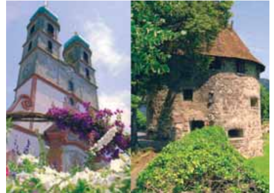
▲ Bad Säckingen, Fridolinsmünster, Gallusturm

Jedes Jahr erfreut ein großer Christbaum, gespendet von der Gemeinde Göstling, vor der Stadtpfarrkirche die Bevölkerung und die Besucher des Purkersdorfer Adventmarktes. Im Rahmen der Partnerschaftsfeiern 2002 erfolgte die Unterzeichnung der Partnerschaftsurkunde mit der Gemeinde Göstling an der Ybbs.