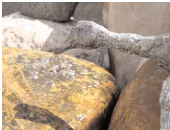
◀ "Entenbrunnen" von Horst Aschermann im Passagenhof Hauptplatz 11

bene Pflegepreis der Allgemeinen Unfallversicherungsanstalt an Angehörige von zu pflegenden Personen besteht aus einem Urlaub, einer Urkunde und dem Relief "Sonnenstiege" von Prof. Horst Aschermann.