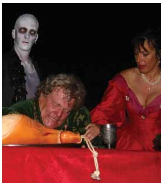
◀ Theatergruppe Purkersdorf