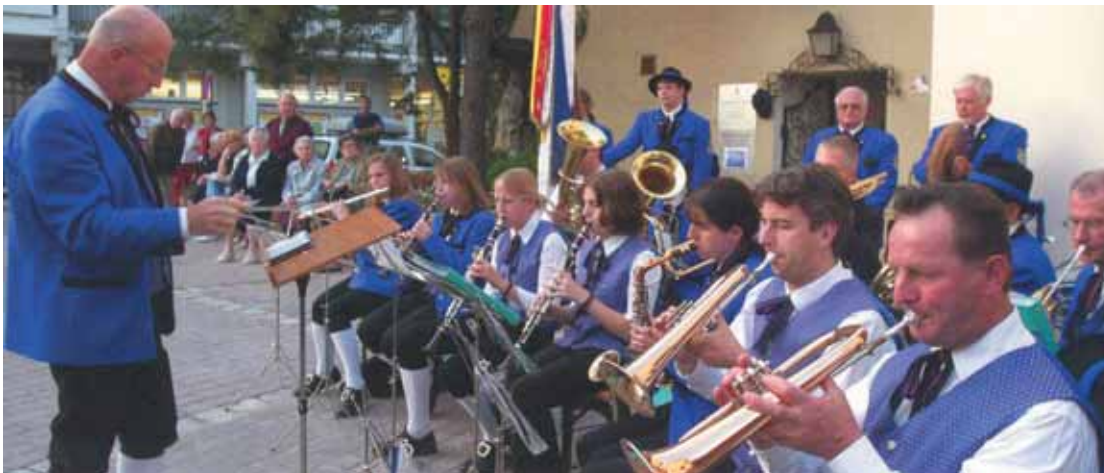
◀ Platzkonzert der Stadtkapelle vor der röm.-kath. Stadtpfarrkirche

Leider löste sich der 1927 gegründete Musikverein Purkersdorf kurz vor der Stadterhebungsfeier 1967 auf. Purkersdorf war ohne Blasmusik. Dieser Zustand wurde von vielen Menschen als schmerzhaft empfunden, mussten doch bei Feierlichkeiten Musikkapellen aus der Umgebung gebucht werden.